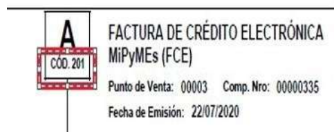
Factura de Crédito Electrónica